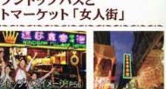
オープントップバスとナイトマーケット「女人街」

深夜まで輝き続けるネオンの看板はアジアの夜の象徴。香港の代表的な夜景をオープントップバスの2階席からお楽しみ下さい。