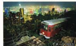
ビクトリアピーク

香港名物でもある水上レストラン。華やかなイルミネーションが輝き、観光スポットにもなっています。