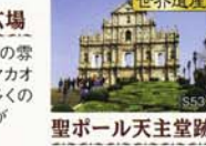
聖ポール天主堂跡

光と音のファンタジーショー。高層ビルから色とりどりのライトが飛び交い、夜空に光が乱舞します。