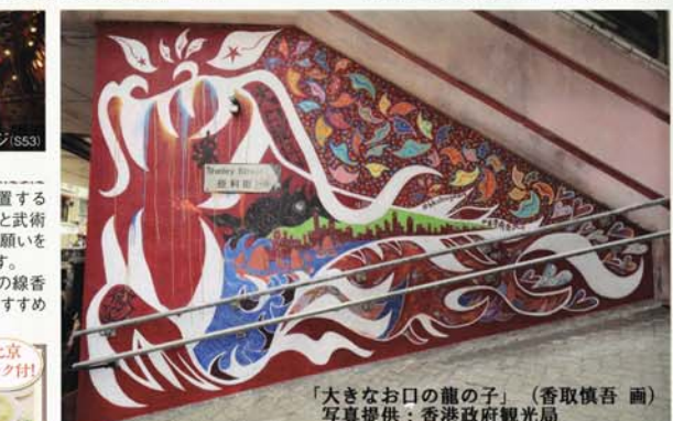
「大きなお口の龍の子」(香取慎吾画)

北京ダック付! ※4月下旬から7月未だまでの予定で、ビクトリアピークはメンテナンス工事のためご利用いただけません。工事期間中は、ビクトリアピークまで、往復バスにてご案内させていただきます。