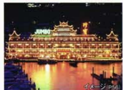
水上レストラン「ジャンボ」(海鮮中華料理)

香港名物でもある水上レストラン。華やかなイルミネーションが輝き、観光スポットにもなっています。