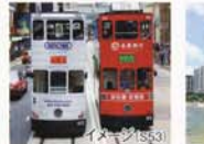
2階建て路面電車(トラム)